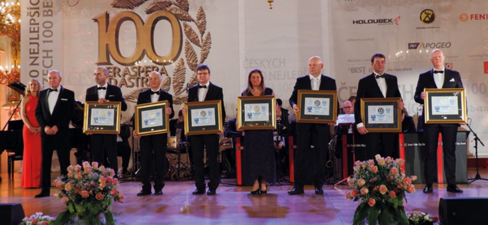
Českých 100 nejlepších 2022

ohrozilo tisíce pracovních míst. Výsledkem složitých jednání v loňském roce byl vznik pracovní skupiny k problematice chráněného trhu práce a zaměstnávání OZP při Ministerstvu práce a sociálních věcí a dvou variant navýšení příspěvku o 600, respektive 1000 Kč. Svaz preferoval druhou variantu navýšení a možnost jeho uplatnění ještě od 2. čtvrtletí 2022. Vláda nakonec v září schválila navýšení v nižší variantě, a to s účinností od 1. října 2022, žádat o něj tak bylo možné až za 3. čtvrtletí 2022.