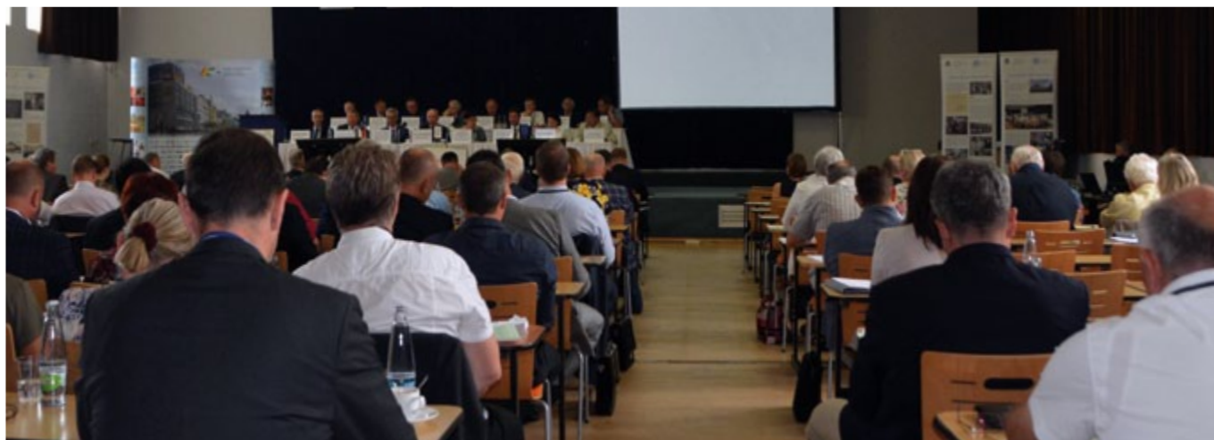
31. Valné shromáždění SČMVD

Výrobní družstva jsou významnou součástí českého hospodářství a svými dlouhodobými výbornými ekonomickými výsledky potvrzují konkuren-