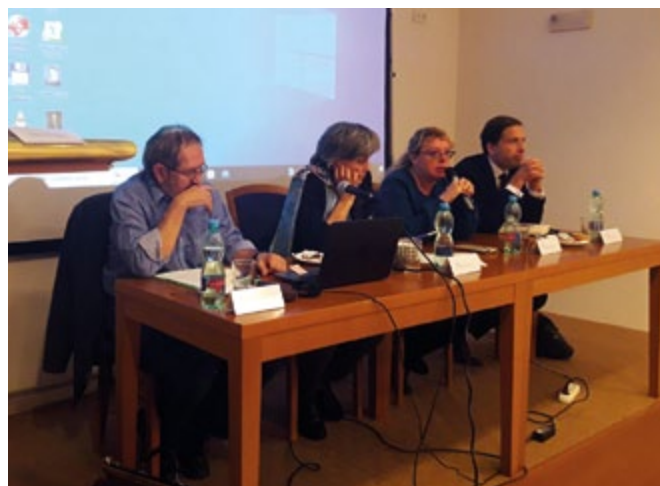
Konference Steady State