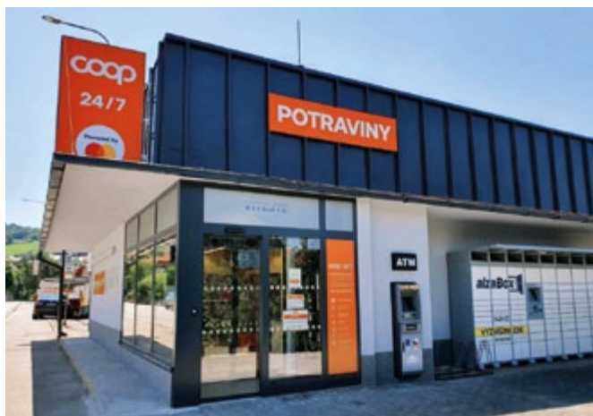
Největší a v pořadí druhá automatická prodejna v Česku Krumlově

Bankovní identita lidem usnadňuje život a zbavuje je části starostí při vyřizování na úřadech i ve firmách. Je způsobem, jak bezpečně, jednoduše a zdarma prokázat totožnost v digitálním prostředí, navíc bez ohledu na provozní hodiny. Používá se stejně, jako funguje přihlašování k internetovému bankovníctví.