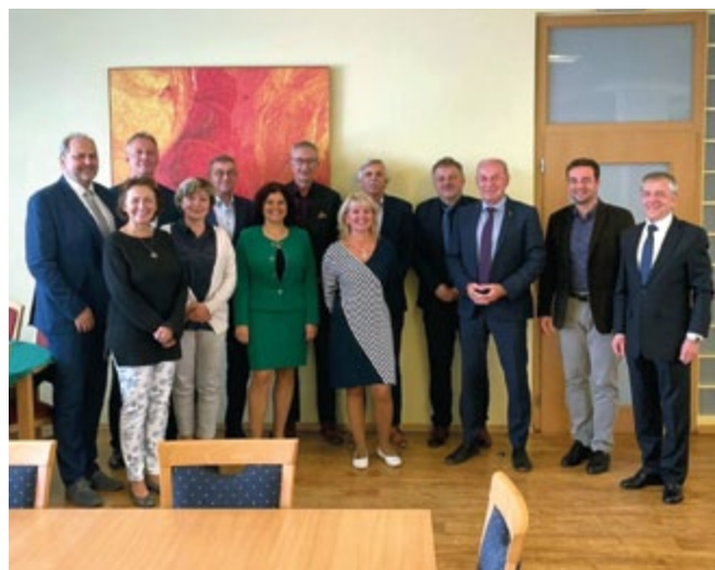
Jednání se slovenskými partnery

Letošní setkání se konalo po nucené tříleté přestávce v souvislosti s pandemií, a navázalo tak na dřívější pravidelná setkání obou družstevních asociací. V budoucnu lze očekávat další podobná setkání, kde si zástupci české i slovenské strany budou vzájemně vyměňovat zkušenosti a tipy, jak zvládnout nelehkou situaci, která nejen česká a slovenská družstva ještě čeká.